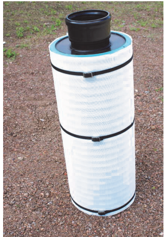
Rohrfilter DN 350 zum Einbau in Betonschächte oder Zisterne